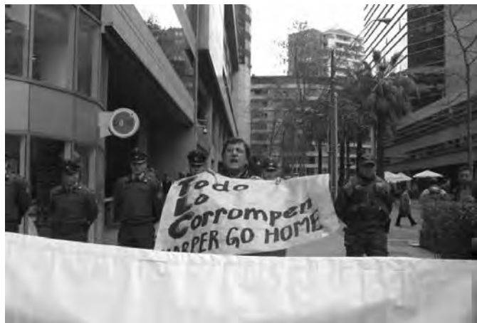
Manifestantes de la Coordinadora Antipascualama de Santiago concurren a las afueras de las oficinas de Barrick Gold en Lyon 222, Providencia, para manifestar su repudio a la visita del Primer Ministro de Canadá, Stephen Harper, en Chile.