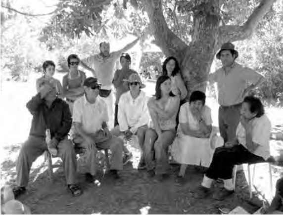
Un gran número de personas del Vle participaron de “El llamado del Agua”.