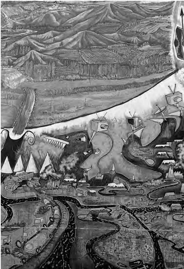
El mural de la iglesia de Alto del Carmen representa la visión de la amenaza de muerte sobre el Valle del Huasco.