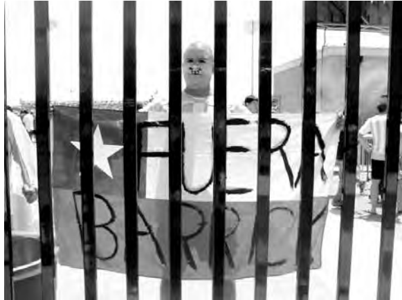
Activistas Antipascualama de Canadá, aprovecharon la cobertura mediática del Mundial Sub 20 en su país, por parte de los medios chilenos, para manifestar su repudio al proyecto de la transnacional canadiense que amenaza el Valle del Huasco.

taba llevando a cabo el Mundial de fútbol Sub 20, donde la selección chilena estaba teniendo un buen desempeño. El envío de una carta de la Presidenta y el apoyo a los muchachos, dio señales de la estadía de la Ministra en el lugar.