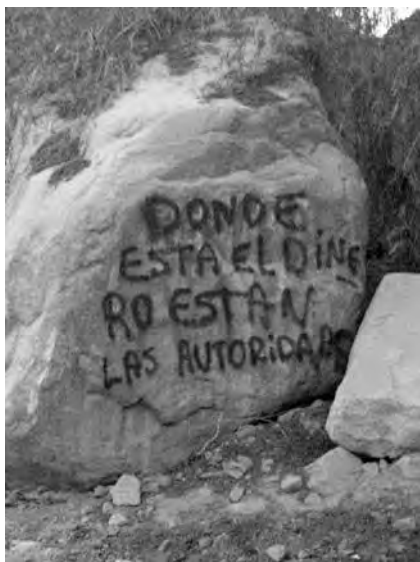
Estos son algunos de los rayados y pintados de rechazo a Pascua Lama que se pueden ver a lo largo de los caminos del Valle.